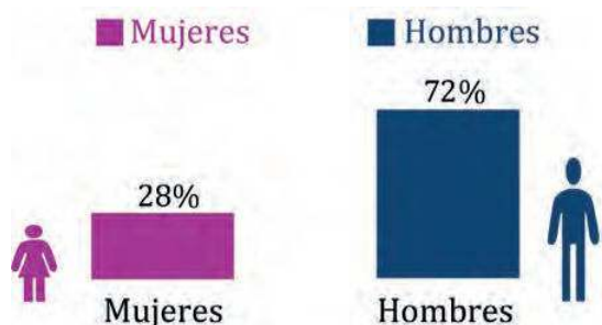
Gráfico n° 1 Jornales de mujeres y hombres participantes en el MERESE hídrico 2023 – 2024 (En %)